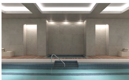
π.χ. εσωτερικές πισίνες

Αυτά τα ανοξειδωτα προϊόντα μπορούν να χρησιμοποιηθούν σε δυσμενέστερα περιβάλλοντα από αυτά της κατηγορίας αντοχής διάβρωσης III και σε περιβάλλοντα ιδιαίτερα έντονης διάβρωσης (π.χ. υποβρύχια ή σε επαφή με θαλασσινό νερό ή σε χλωριούχα περιβάλλοντα εσωτερικών πισινών ή περιβάλλοντα με χημική ρύπανση).